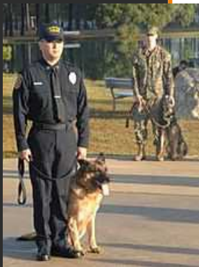
Un chien policier

Le berger allemand, appelé aussi le berger d'Alsace est une race de chiens tirant son nom de son pays d'origine, l'Allemagne.